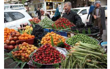
Gemüseverkäufer in Sulaimanyia, der zweitgrößten Stadt in der autonomen Region Kurdistan.