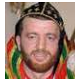
Mor Polycarpus (Holland), Der Tur Abdin – lebendiges Zentrum des syrischen Christentums?