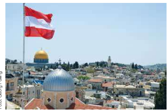
Blick vom Dach des Pilger-Hospizes auf die Altstadt von Jerusalem (im Hintergrund der Feisendom).

Auch soziale Anliegen seien wichtig, sagt der Rektor: „Ob es nun um Menschen in Krankheit oder um Wohn-