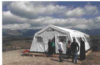
... und aktuelle Aufnahmen (Kindergartenzeit für christliche Flüchtlinge im Irak 2015) runden das Buch ab.