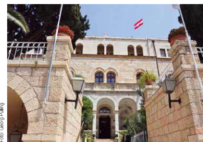
Seit 1863 weht – mit Unterbrechungen - die österreichische Flagge im Herzen der Jerusalemer Altstadt.

raumsanierungen geht, um Ausbildung oder Schulgelder. Wir versuchen zu helfen, wo wir können; auch und insbesondere der katholischen Pfarre in Gaza.“ Hospiz-Rektor Georg Gatt gründete 1879 die Missionsstation Gaza, aus der die heutige katholische Stadtpfarre „Zur Heiligen Familie“ hervorging.