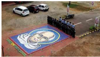
Elias Chavara

Er war auch ein Pionier der katholischen Pressearbeit: in Mannanam gründete er 1846 die erste katholische Druckerei im heutigen Kerala, in der die erste Publikation in