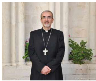
Erzbischof Pierbattista Pizzaballa leitet seit 2016 als Apostolischer Administrator das Patriarchat.