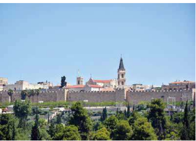
Prägnanter Anblick: Die Türme der Patriarchatskirche und des Patriarchatssitzes in der Jerusalemer Altstadt.

Dem Lateinischen Patriarchat gehören rund 90 Priester an, 73 Frauenorden und 32 Männerorden wirken zudem im Heiligen Land. Das Patriarchat bzw. diese Gemeinschaften unterhalten viele Werke in den Bereichen Bildung und Gesundheitsvorsorge. Dazu gehören beispielsweise 41 Schulen und 35 Kindergärten sowie eine Universität in Madaba (Jordanien).