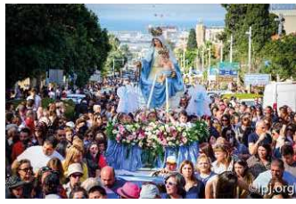
Katholische Marienwallfahrt in der israelischen Hafenstadt Haifa.

In Israel ist die katholische Kirche des lateinischen Ritus mit 6 Pfarrgemeinden vertreten, in Palästina mit 12, in