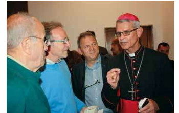
Begegnung mit Bischof Raban Al-Quas, dem chaldäischen Bischof von Amadya-Shamkan.