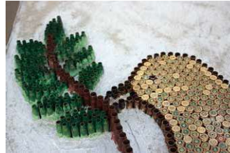
Telskof: Aus Patronenhülsen geformte Friedenstaube an der Wand der Georgskirche.

Besucht wurden auch zwei mit Unterstützung der ICO geschaffene bzw. von ICO unterstützte Kindergärten in Enishke und Sulaimanyia.