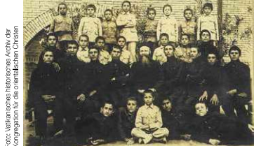
Historische Aufnahmen (hier armenische Waisenkinder im Iran im Jahr 1923) ...

Juli, August Sommeröffnungszeiten Di, Mi, Do 9-12 Uhr