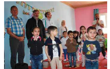
Die Delegation besucht den von der ICO finanzierten Kindergarten in Enishke.

Beim Besuch des Dorfes Telskof in der Ninive-Ebene, das in die Hände der IS-Terroristen gefallen und geplündert und schwer zerstört worden war, bekam man einen Eindruck von den Schrecken, dem die christlichen Bewohner dieser Region ausgesetzt waren. Besonders erfreulich war aber zu sehen, dass die schwer zerstörte Georgskirche bereits wunderschön und mit viel Geschmack renoviert worden ist. An der ebenfalls zerstörten Jakobskirche wird gerade gearbeitet. Auch mehrere von der ICO finanzierte Wirtschaftsprjekte im Ort ermutigen die Bewohner zum Bleiben. Eindrucksvoll und hoffentlich bestimmend für eine bessere Zukunft ist eine aus Patronenhülsen geformte Friedenstaube an der Wand der Georgskirche.