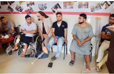
Die Caritas trägt wesentlich zur medizinischen Versorgung in Gaza bei.