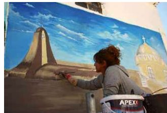
Telskof: Eine muslimische Künstlerin malt eine Kirche an die Wand eines vom IS zerstörten Hauses.