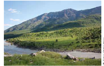
Frühling in Kurdistan: Auf den Bergen liegt noch Schnee doch in den Tälern ist schon alles grün.