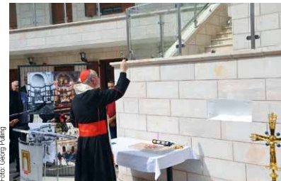
Der Wiener Erzbischof Kardinal Christoph Schönborn segnet die neue „Casa Austria“.