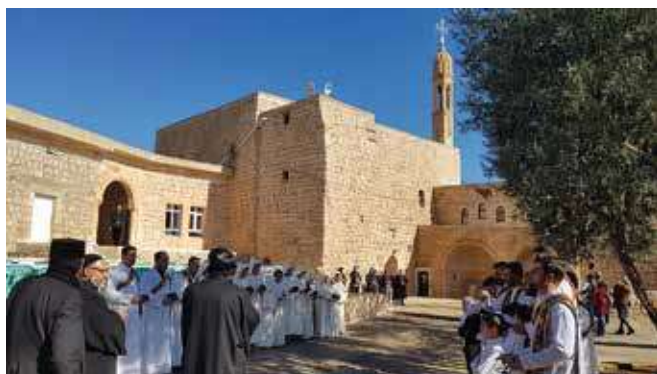
Bischofsbesuch in der Kirche Mor Dodo in Bsorino.